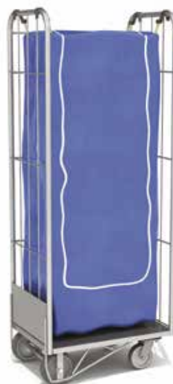
CABRI 125 HIU