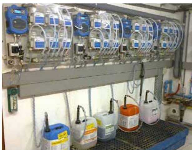
INSTALLATION SMART PUMP POUR 6 PRODUITS ALIMENTANT 4 LAVEUSES ESSOREUSES