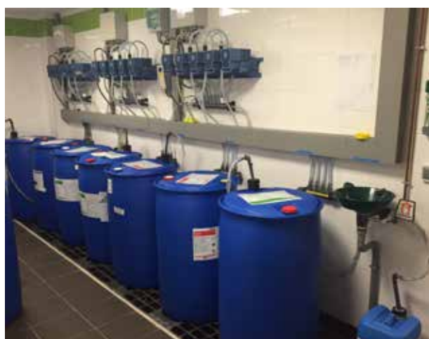
INSTALLATION TURBO PUMP POUR 5 PRODUITS ALIMENTANT 3 LAVEUSES ESSOREUSES