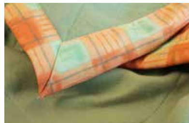
Finition coin capuchon