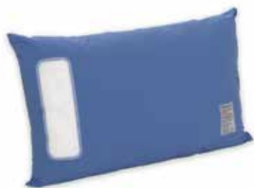
Traversins anti-punaises de lit