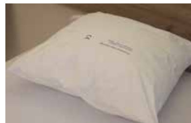
Oreiller anti-punaises de lit