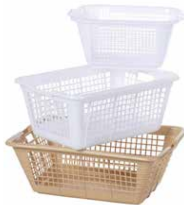
COR/P + COR/G