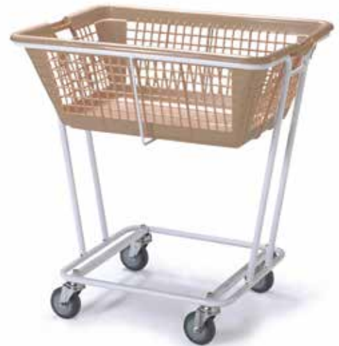
PCOR + COR/G