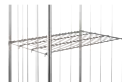
Option tablette de fond en PVC