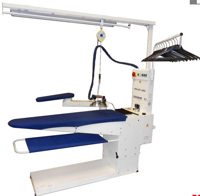
TABLE DE REPASSAGE TRIANGULAIRE CHAUFFANT, ASPIRANT OU ASPIRANT SOUFFLANT HAUTEUR REGLABLE PAR RESSORT A GAZ

Compact et autonome avec chaudière tout inox incorporée 3,5 kW à brancher sur réseau d'eau.